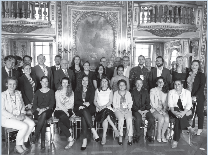
Talleres París y Barcelona, julio 2016/Workshops Paris and Barcelone, July 2016/Ateliers Paris et Barcelone, juillet 2016/ Workshops Paris e Barcelone, julho 2016