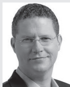
Mauricio Rodas Espinel Prefeito do Distrito Metropolitano de Quito

A II Assembleia Mundial de Autoridades Locais e Regionais que ocorreu um dia antes da III Conferência sobre Moradia e Desenvolvimento Urbano Sustentável – Habitat III, em Quito, constituiu um marco histórico para o papel que irão exercer os governos locais e regionais na implementação da Nova Agenda Urbana.