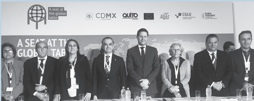
Acto mediático/ Media Act/Événement Médiatique/Evento de Mídia