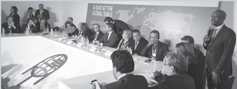
II Assembleia Mundial de Autoridades Locais e Regionais