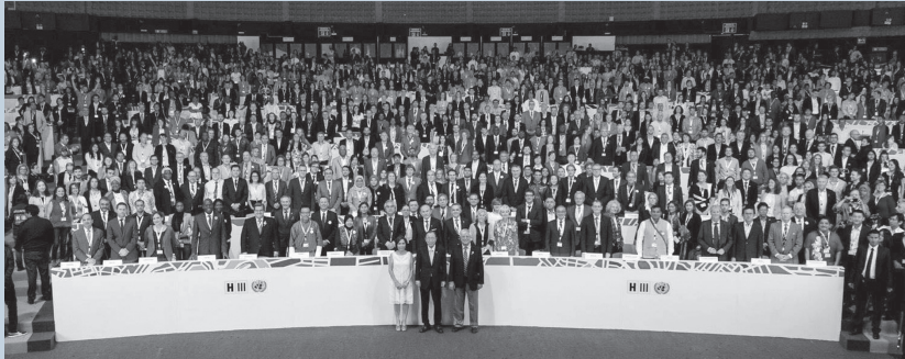
II Asamblea Mundial de Autoridades Locales y Regionales.