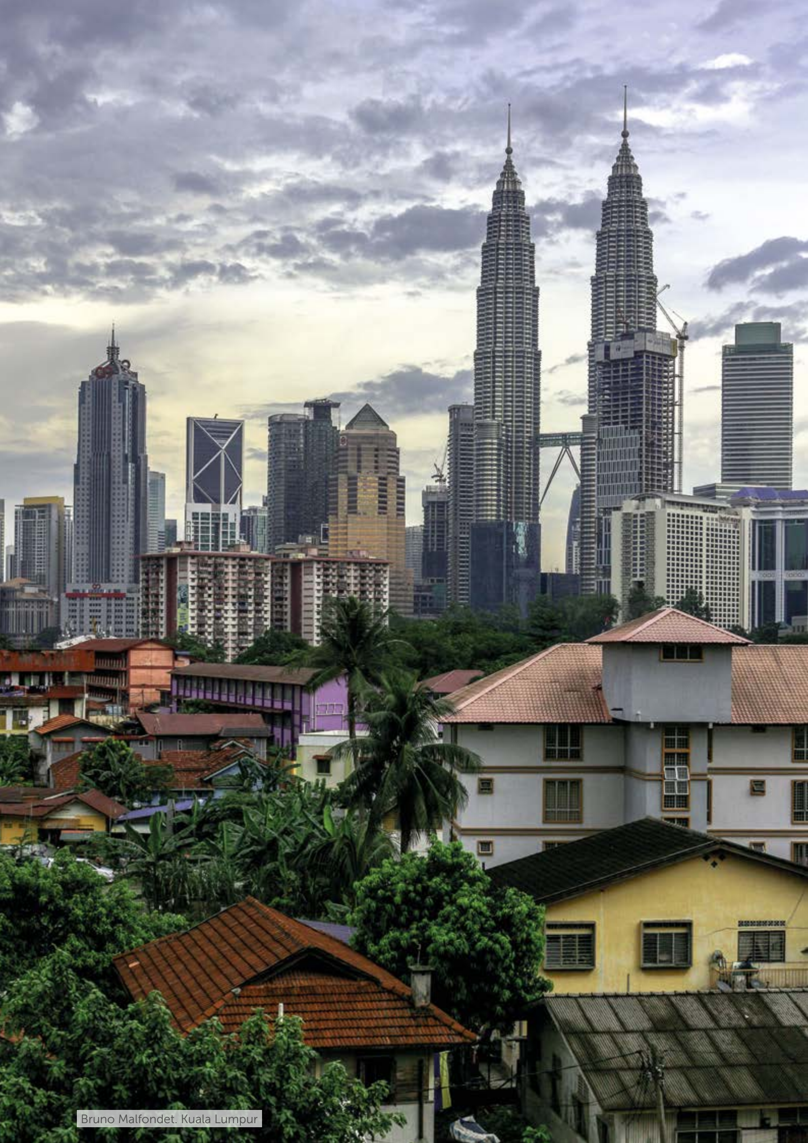
Bruno Malfondet. Kuala Lumpur