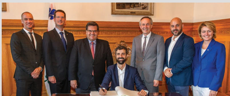
Ville de Montréal

Le congrès sera une occasion de rassembler les métropoles ainsi qu'un ensemble de partenaires afin d'échanger sur les enjeux locaux et globaux, de faire valoir les approches expérimentées, et surtout de tracer la voie vers l'avenir.