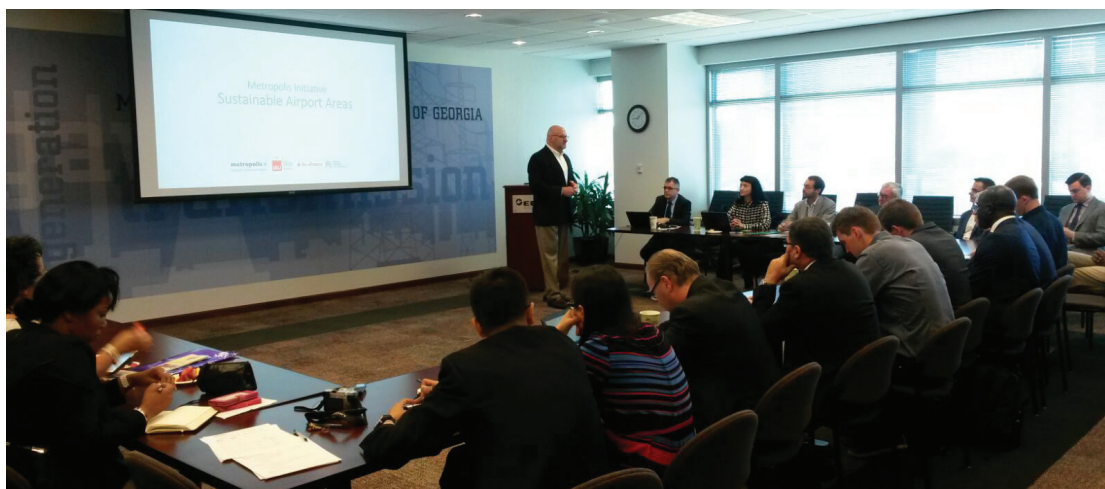
Initiative places aéroportuaires durables, 2e atelier

Membres de Metropolis: Atlanta, Barcelone, Beijing, Dakar, Île-de-France.