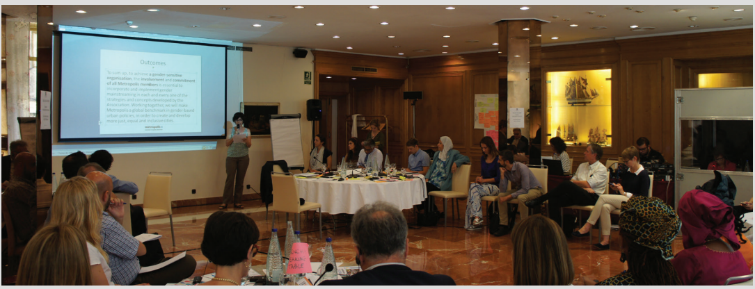
Séance finale de la réunion sur l'orientation stratégique

Pendant le premier jour, les participants ont réfléchi à la mission et à la vision de l'association. Ils ont débattu au sujet des principaux défis actuels de la gouvernance urbaine et sur la façon dont Metropolis peut apporter un soutien à ses membres