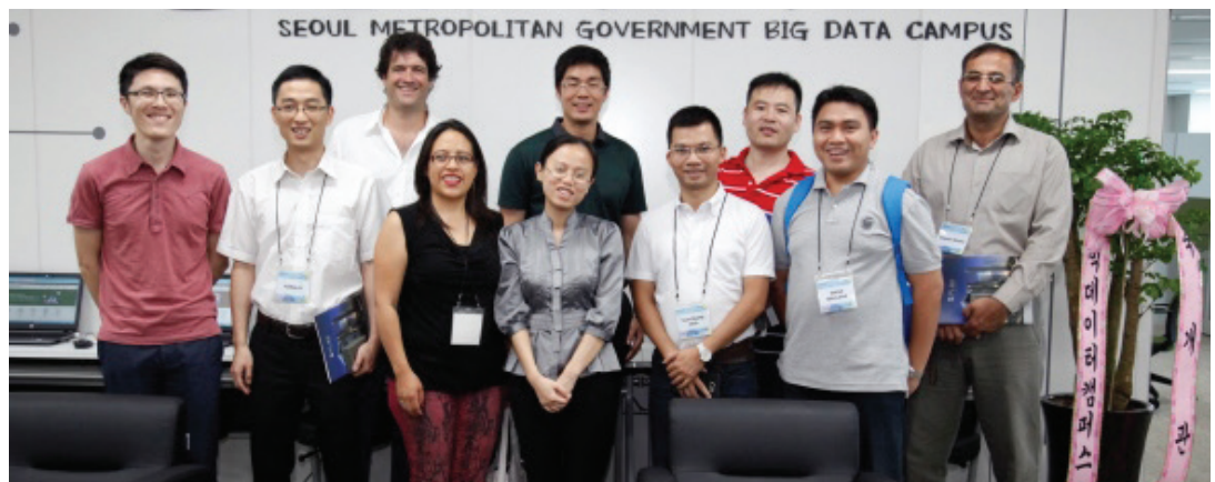
Participants de la Formation sur e-Gouvernance

Membres de Metropolis: Guangzhou, Hanoi, Jakarta, Medellín, Quito, Séoul, Shanghai, Chiraz, Taipei.