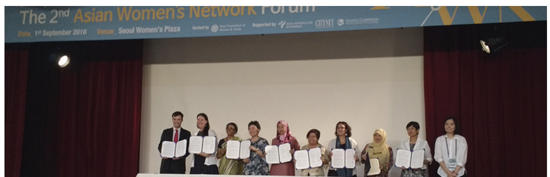
2e Forum de réseaux de femmes asiatiques

Membres de Metropolis: Séoul, Barcelone.