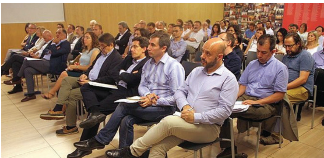
Débat sur les stratégies Internationales partagées

Membres de Metropolis: Ville de Mexico, Johannesburg, Medellin, Montréal, São Paulo (État), Séoul.