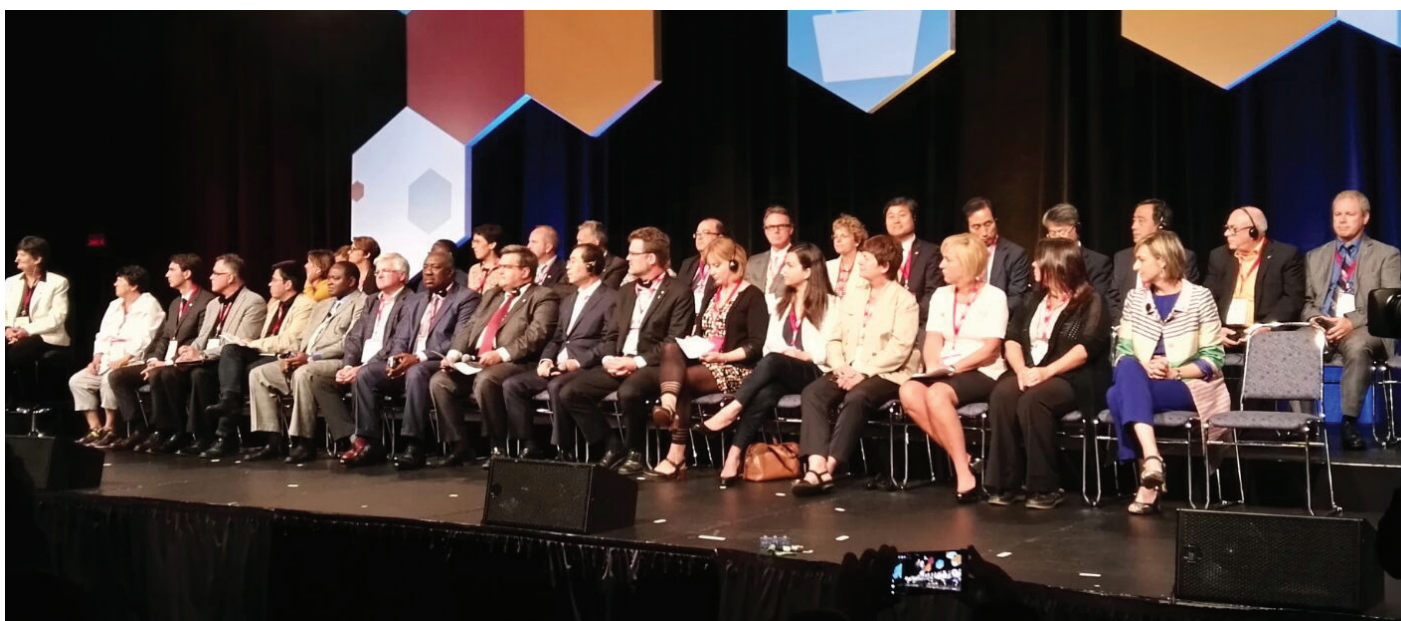
Sesión du GSEF 2016