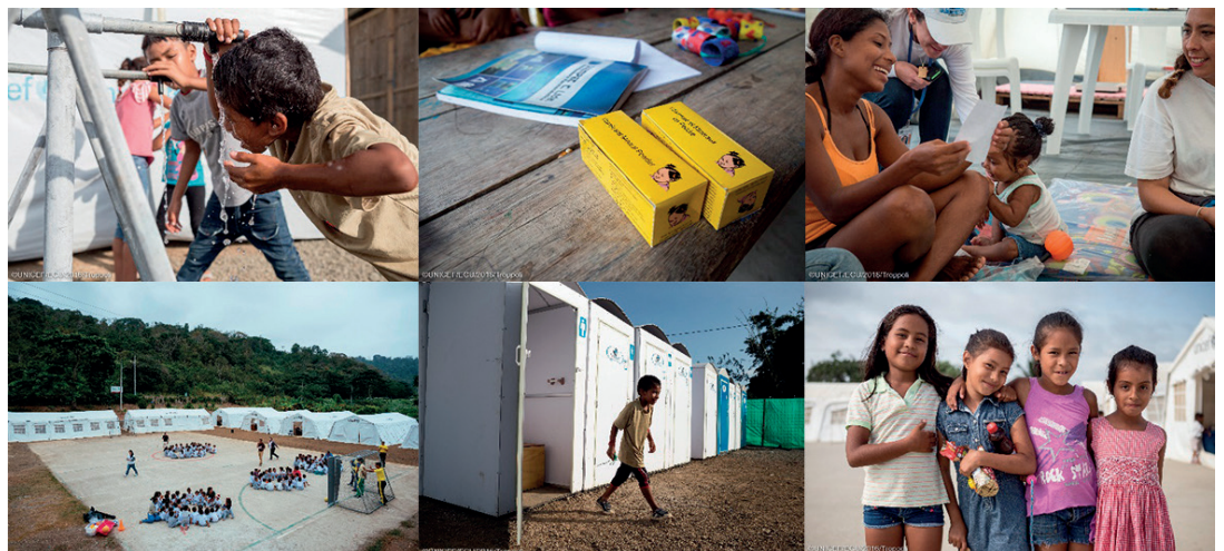
Programmes pour aider les enfants, adolescents et familles affectés par le séisme