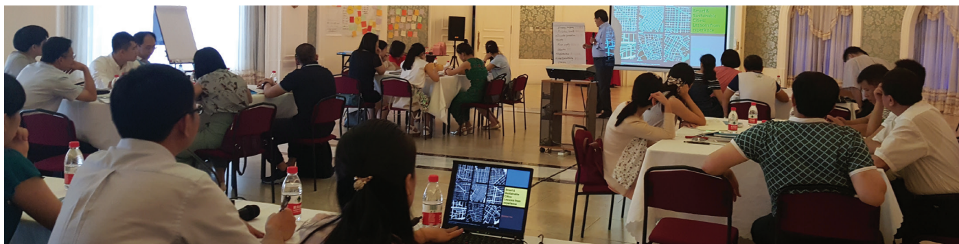
Formation sur Innovation urbaine