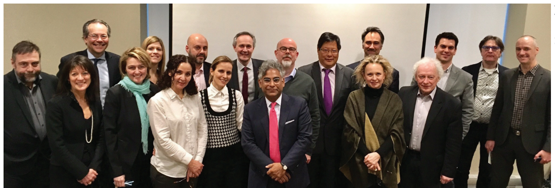
Reunión preparatoria del Congreso