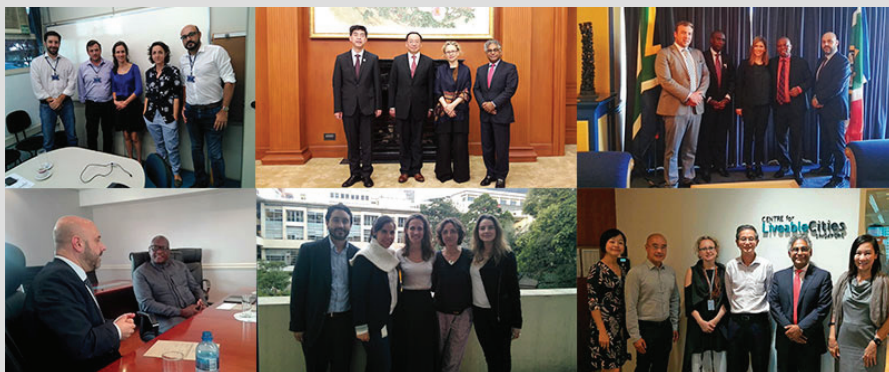
Reuniones de promoción

Bogotá, Gauteng, Guarulhos, Johannesburgo, Medellín, Montréal, Ciudad de Sao Paulo.