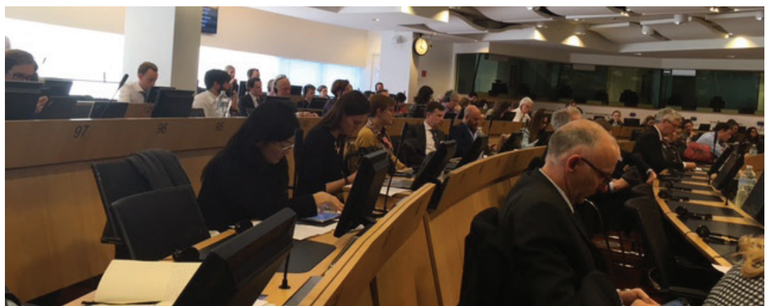
Conferencia Áreas metropolitanas en la futura política de cohesión

Miembros de Metropolis: Barcelona, Región de Bruselas.