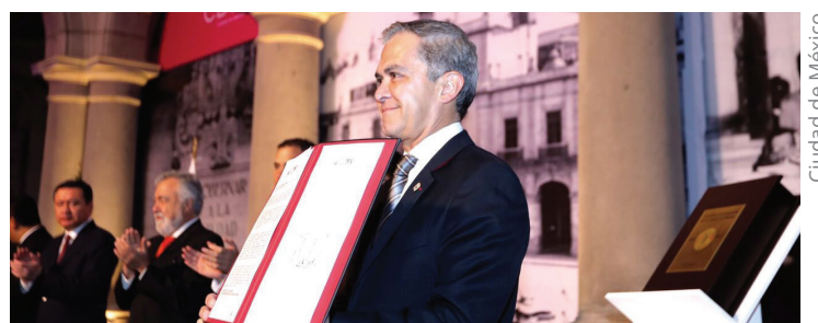
Acto de promulgación de la primera Constitución Política de la Ciudad de México