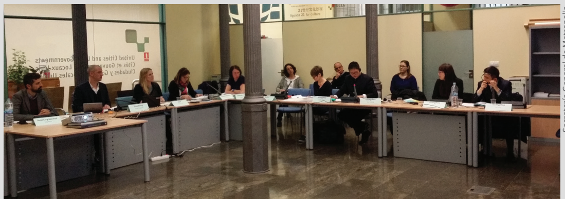
Reunión de secretarías regionales 2017

Miembros de Metropolis: Barcelona, Berlín, Guangzhou, Ciudad de México, Montréal, Región de Bruselas.