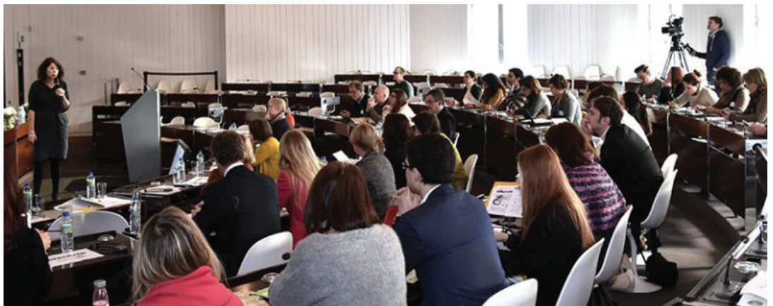
Compartiendo prácticas de transversalización de género en políticas locales y subnacionales

Miembros de Metropolis: Barcelona, Región de Bruselas, Ciudad de México, Seúl.